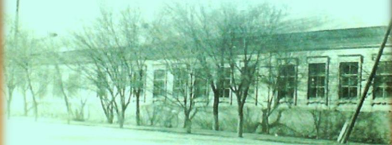
ШКОЛА ИМ.КРУПСКОЙ С. РЕМОНТНОЕ