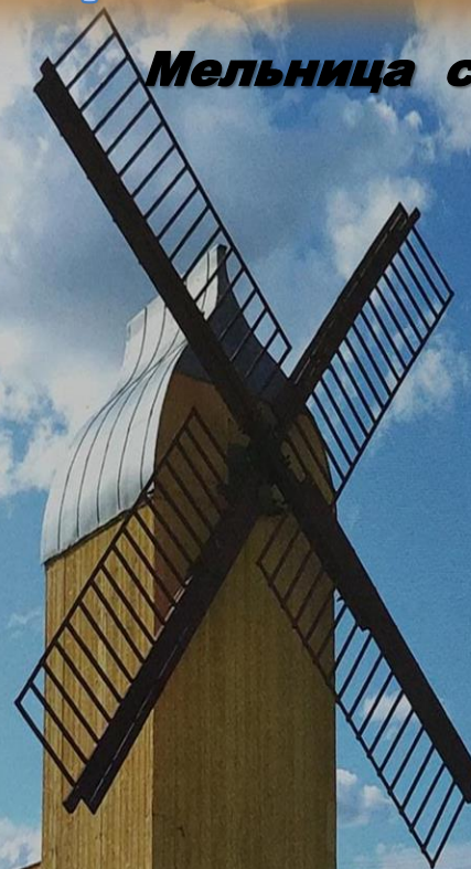
Мельница с. Б-Ремонтное