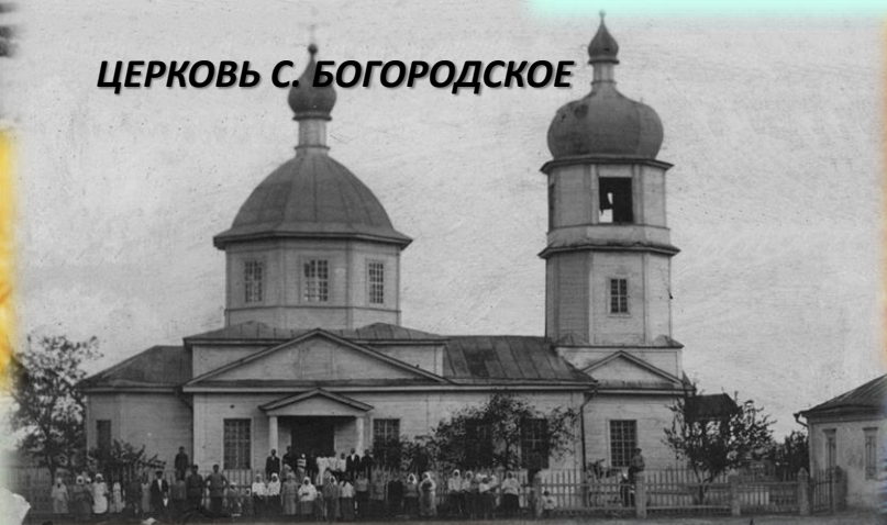
ЦЕРКОВЬ С. БОГОРОДСКОЕ