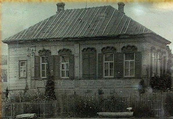
ШКОЛА С. РЕМОНТНОЕ