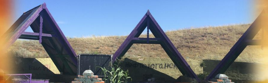
Степная археологическая экспедиция Государственного исторического музея г. Москвы