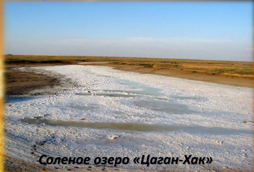
Соленое озеро «Цаган-Хак»