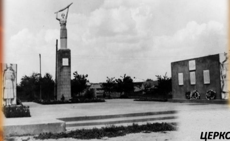
РОДИНА МАТЬ С. РЕМОНТНОЕ