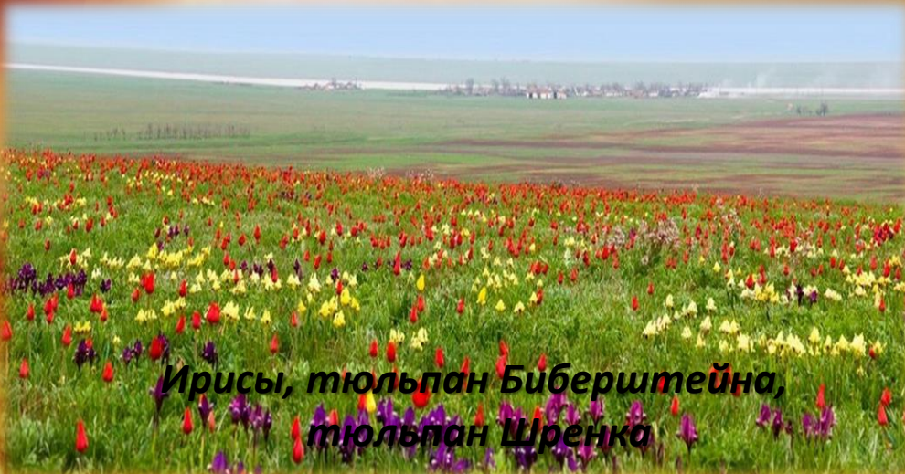
Ирисы, тюльпан Биберштейна, тюльпан Шренка